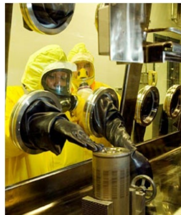
Figura 2. Guantera

Una guantera (figura 2) es un recinto que separa los trabajadores del equipo utilizado para procesar materiales peligrosos, al mismo tiempo permitiendo que los trabajadores tengan contacto físico con el equipo. Las guanteras normalmente están construidas de acero inoxidable, con grandes ventanas de vidrio acrílico/plomo. Los trabajadores tienen acceso al equipo mediante el uso de guantes de goma de alta resistencia impregnados con plomo, cuyos puños están sellados a la ventana de la guantera.