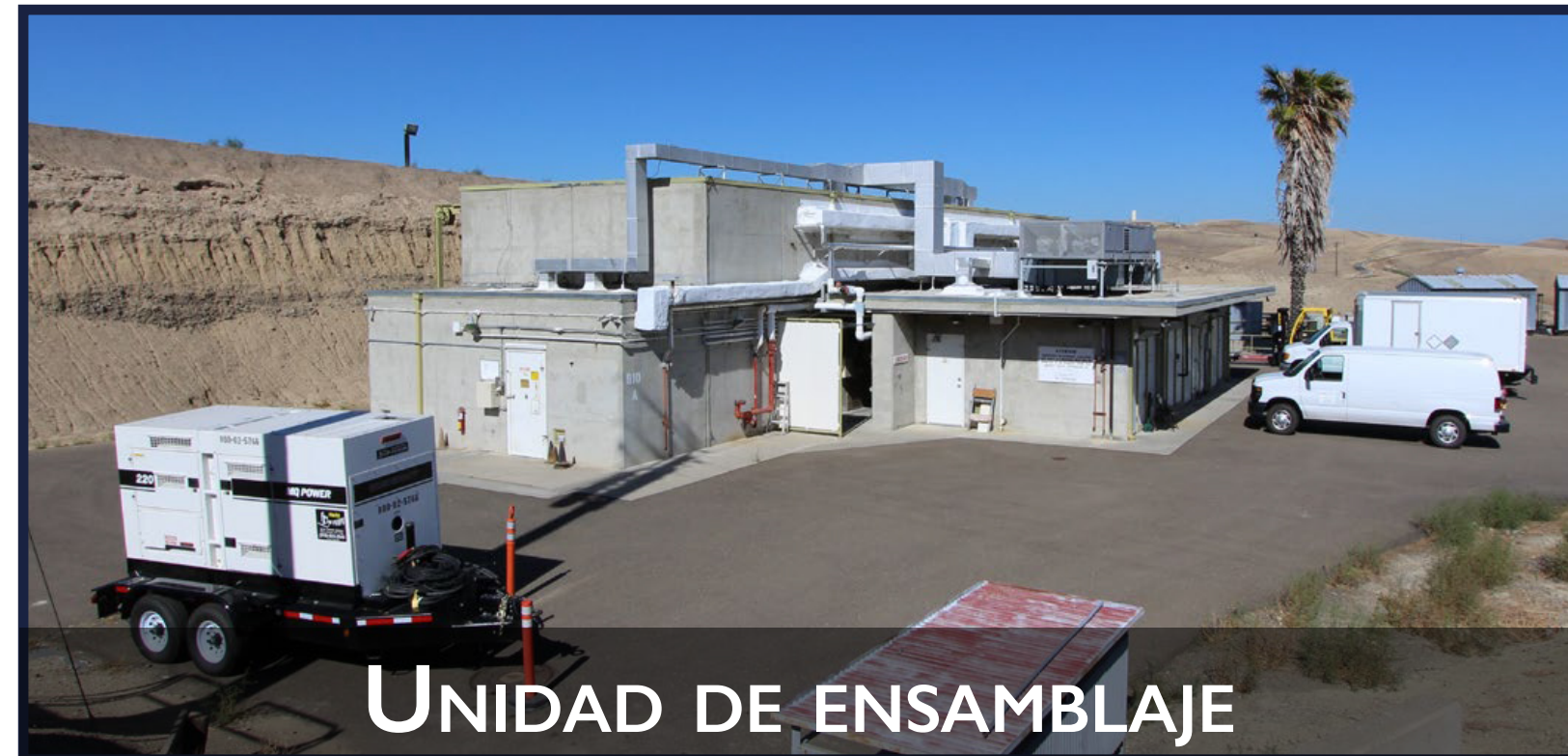
UNIDAD DE ENSAMBLAJE