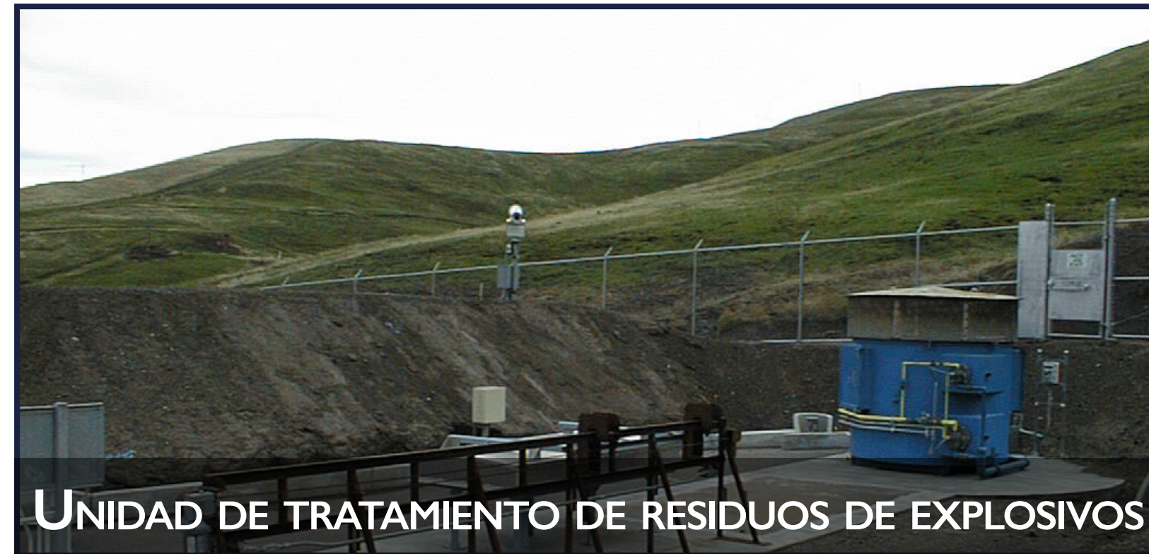
UNIDAD DE TRATAMIENTO DE RESIDUOS DE EXPLOSIVOS