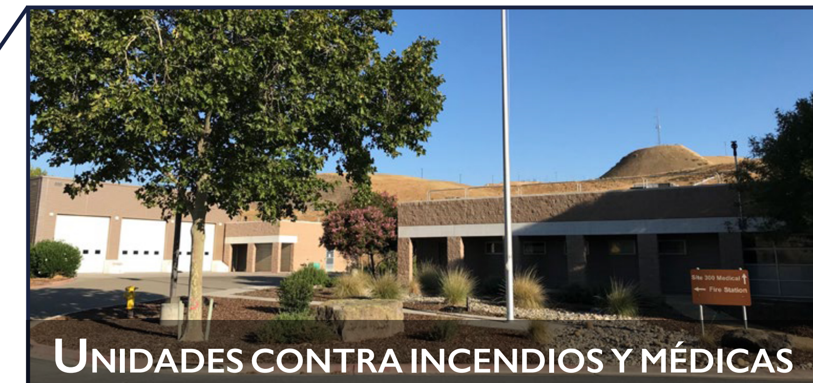
UNIDADES CONTRA INCENDIOS Y MÉDICAS