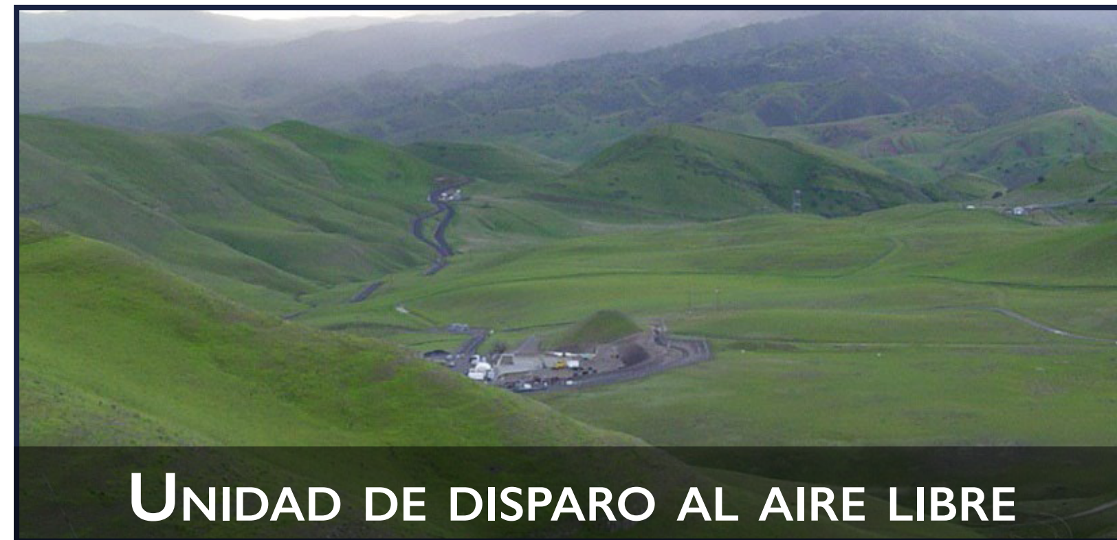
UNIDAD DE DISPARO AL AIRE LIBRE