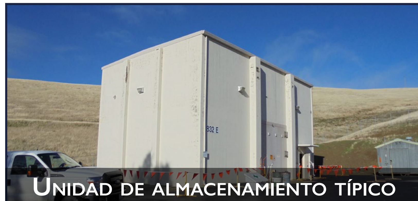
UNIDAD DE ALMACENAMIENTO TÍPICO