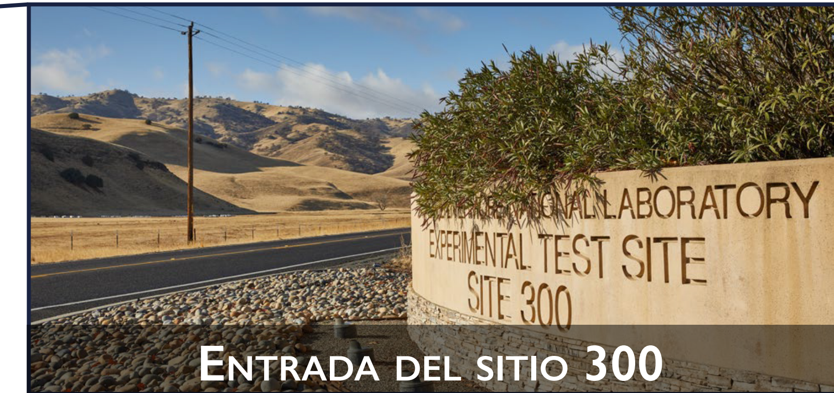
ENTRADA DEL SITIO 300