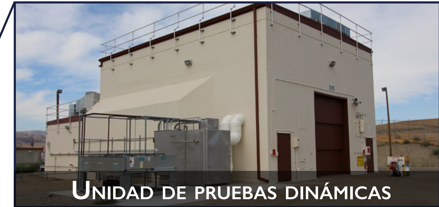
UNIDAD DE PRUEBAS DINÁMICAS