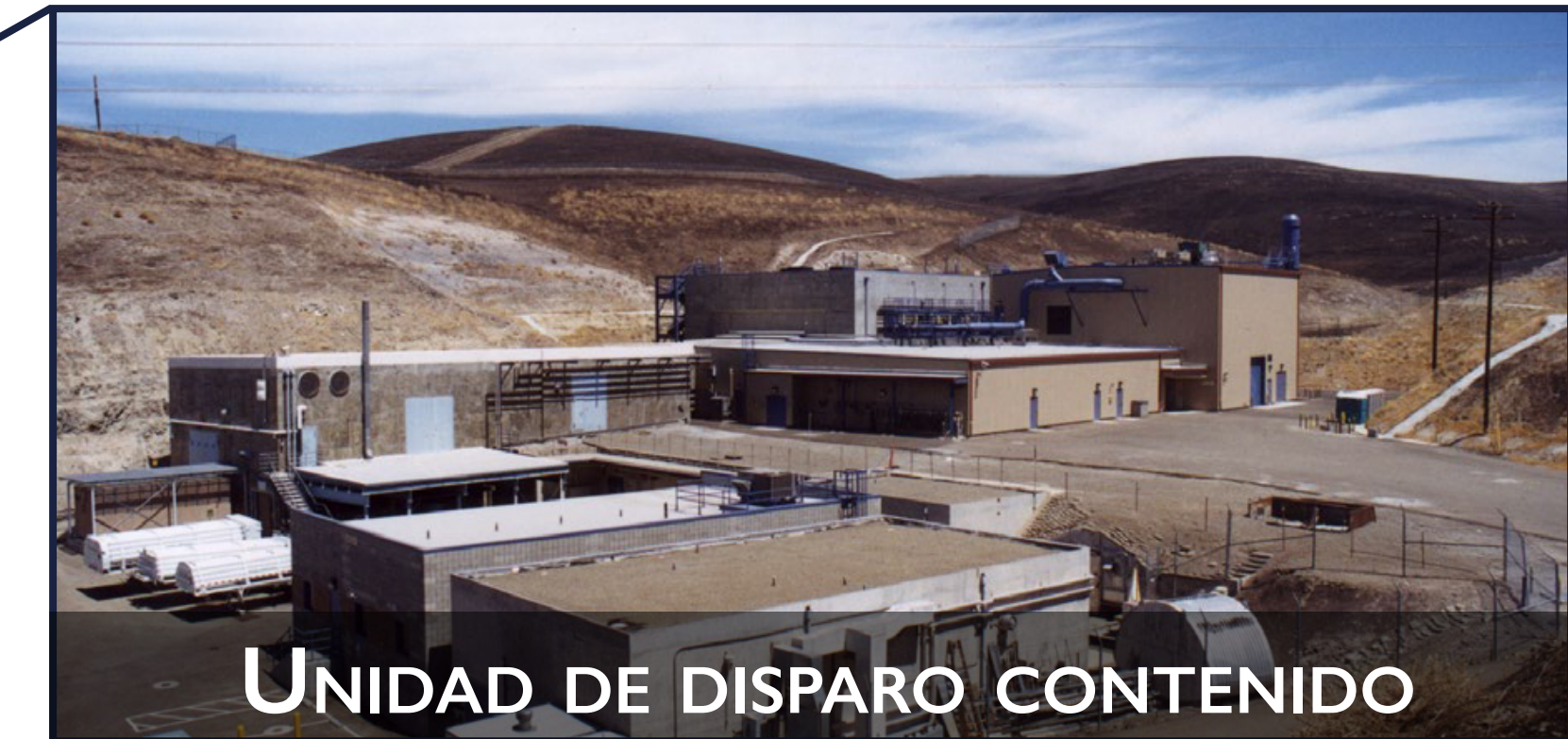
UNIDAD DE DISPARO CONTENIDO