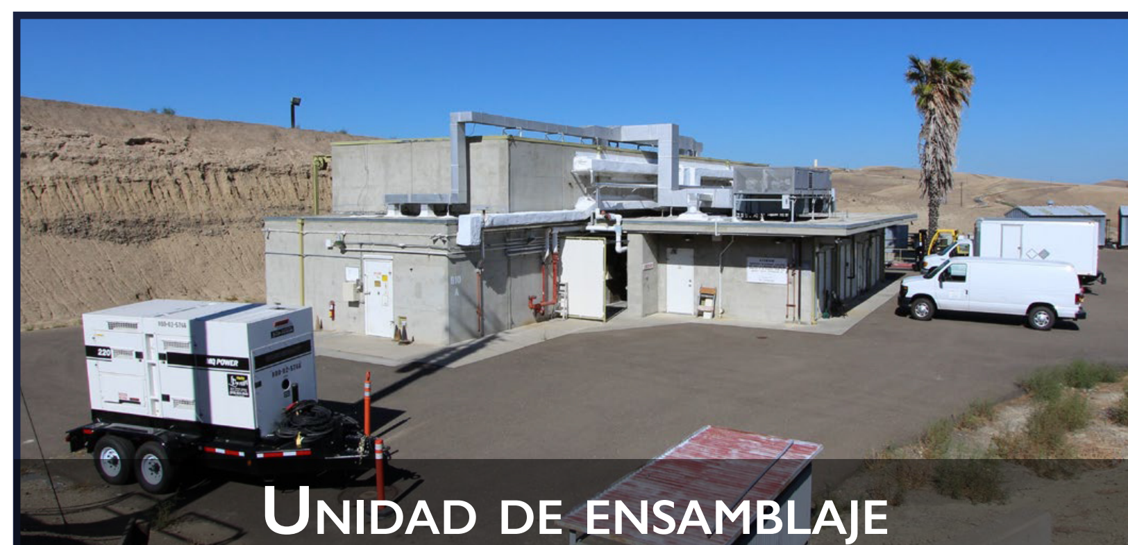
UNIDAD DE ENSAMBLAJE