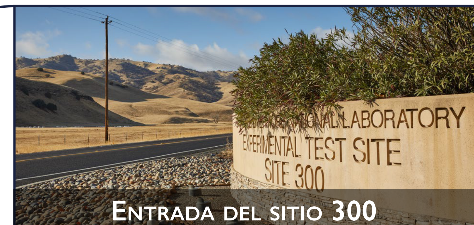
ENTRADA DEL SITIO 300