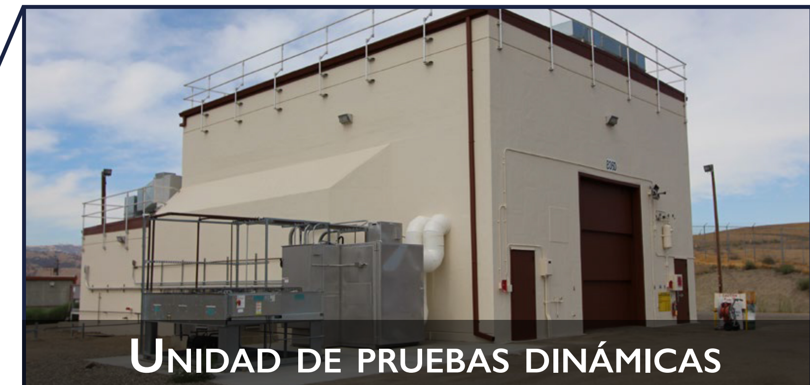
UNIDAD DE PRUEBAS DINÁMICAS