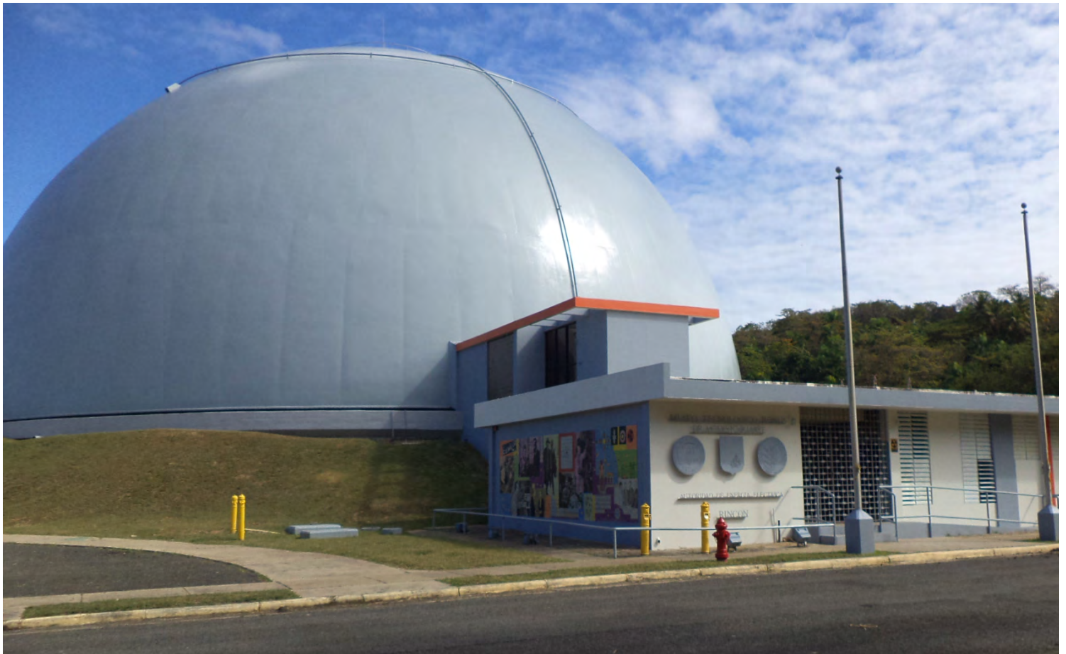
La cúpula del reactor de la central BONUS fue repintada en 2014.

Se realizó una descontaminación general del reactor para satisfacer los criterios requeridos para el uso sin restricciones de todas las áreas accesibles del edificio. Los materiales radioactivos residuales que quedaron dentro de la estructura fueron aislados o blindados para proteger a trabajadores y visitantes de la facilidad. En los años subsiguientes se descubrió contaminación adicional en partes del edificio, y por ello se realizaron actividades adicionales de limpieza y blindaje en los años 1990 y a principios de la década del 2000.